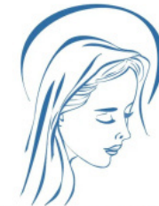
L'Espérance en Marie